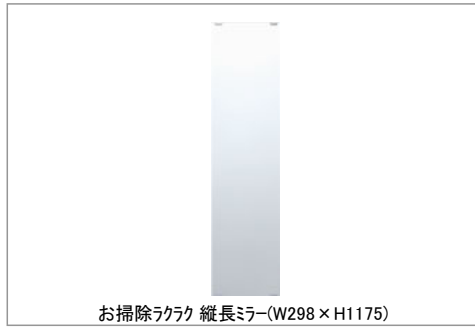
お掃除ラック 縦長ミラー(W298×H1175)