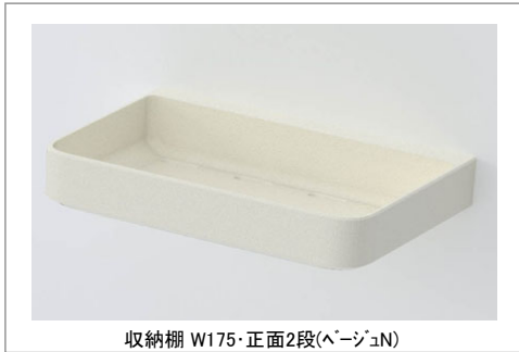
収納棚 W175・正面2段(ベージュN)